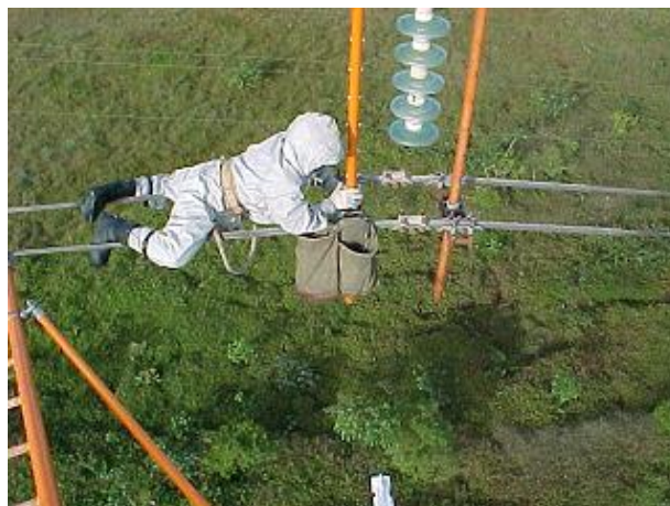
FIGURA 2 Manutenção de linhas energizadas ao potencial.

As condições atmosféricas também devem estar favoráveis, com tempo firme, com sol claro e sem ventos fortes.