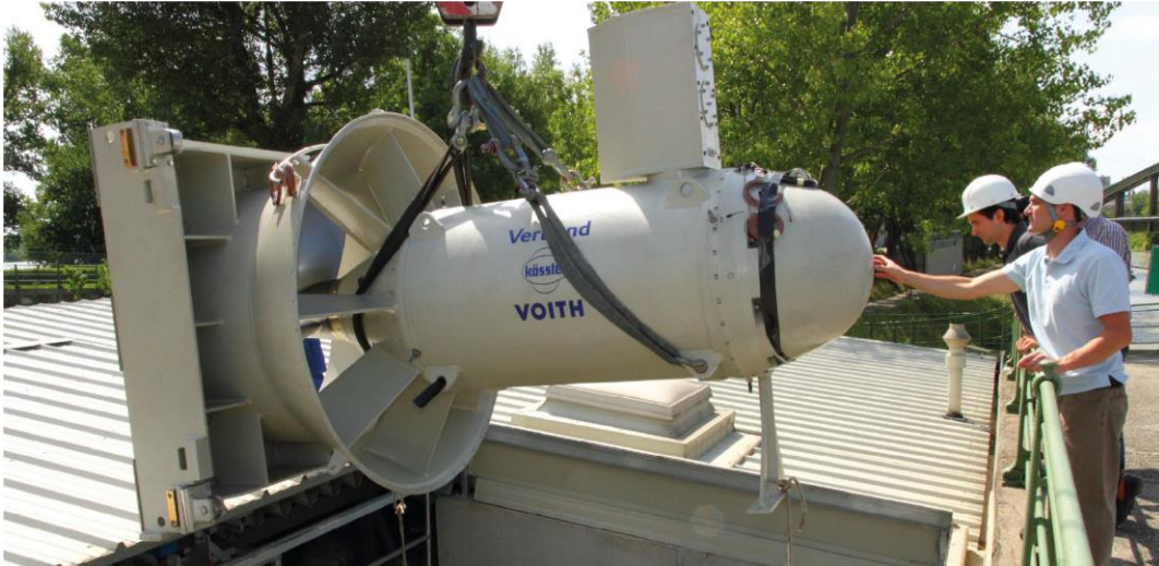
Figura 1: Unidade geradora compacta StreamDiver