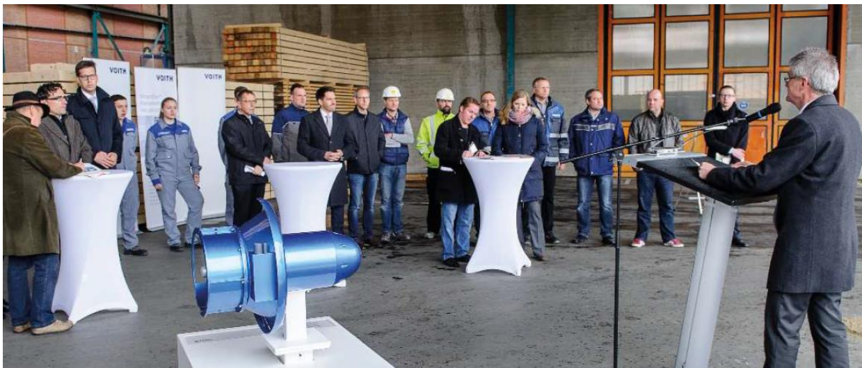
Figura 3: O projeto 'Alte Bleiche' integrou os estagiários técnicos da Voith Hydro de maneira muito intensa.

Especialmente interessante para os colaboradores da Voith Hydro é a integração excepcionalmente intensa dos estagiários técnicos da empresa (Figura 3). Entre outras especialidades, eles foram integrados nas áreas de projeto, fabricação e montagem da turbina, inclusive ficando responsáveis pela montagem do painel de controle. Além disso, alguns alunos da Universidade dual de Baden-Württemberg também foram envolvidos no gerenciamento de projetos. "A Pequena Central Hidrelétrica 'Alte Bleiche' é um projeto altamente interdisciplinar e muito importante para os nossos estagiários, que contribuirão de maneira significativa para o seu sucesso. Além disso, com este projeto fortaleceremos a nossa reputação como uma empresa atraente do ponto de vista de treinamento", afirma Erwin Krajewski, gerente da área de treinamento da Voith.