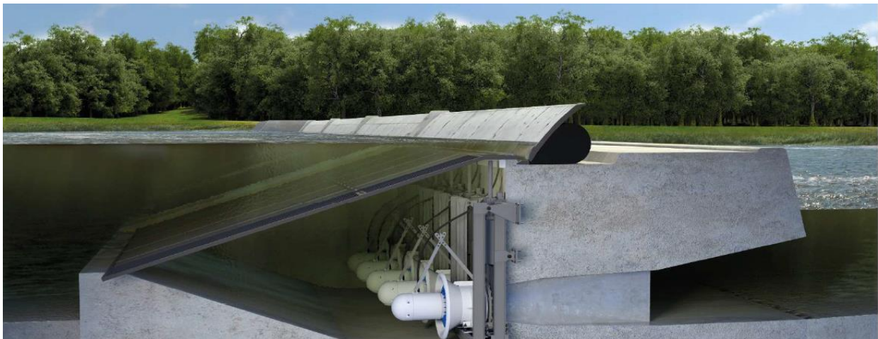
Figura 4: Aplicação modular da StreamDiver

Embora a hidroeletricidade seja responsável pela maior parte da geração de energia renovável do mundo, ainda existe muito potencial hidrelétrico a ser explorado. Até recentemente, as usinas a fio d'água com baixas quedas (< 8 m) eram vistas como antieconômicas e, assim, muitas vezes permaneciam inexploradas. A StreamDiver é uma excelente solução para aproveitamento desse potencial não explorado, uma vez que trata-se de conjunto turbina-gerador especialmente projetado para ser utilizado em locais onde as usinas convencionais podem ser inviáveis. Todo o conjunto de acionamento da StreamDiver, constituído pela turbina, eixo, mancais e gerador, é montado em uma carcaça do tipo bulbo e seus mancais são lubrificados pela própria água do rio ou canal, completamente isenta de óleo ou graxa. A unidade geradora é submersível e pode ser instalada diretamente em sistemas de açudes, canais ou represas, exigindo apenas pequenas modificações nas estruturas existentes. A sua faixa de potências vai de 50 kW a 800 kW. No entanto, sua solução modular permite equipar instalações de maior potência com facilidade (Figura 4). Seu projeto inovador também permite minimizar os custos de operação e manutenção em comparação com os conceitos tradicionais de turbinas, uma vez que demanda menores quantidades de equipamentos auxiliares elétricos e mecânicos.